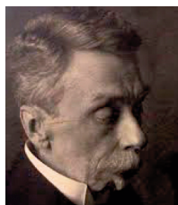
EDUARD VON KEYSERLING

En Bill, fill d'una família aristocràtica, ha suspès els exàmens d'accés a la universitat. Com a càstig, durant l'estiu, en comptes de passar les vacances prop del mar amb la mare i els germans, s'haurà de quedar estudiant a la finca de la família, en companyia del seu pare, amb qui amb prou feines ha tingut mai tracte. A mesura que passen els dies, en un ambient de calor sufocant, en Bill comença a intuir el caràcter real del pare, que dista molt de la imatge que amaga darrere de les convencions socials.